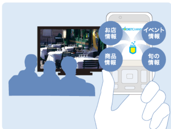
テレビの気になる情報をケータイでゲット！

たとえば、テレビで気になったレストランに行きたいと思ったとき。「あれ、レストランの名前は何かだっけ？」「場所はどこだっけ？」と困ったことはありませんか？そんなとき、知りたい情報をコンシェルジュのように教えてくれるのが、携帯電話の新しいサービス「ポケットチャンネル」です。